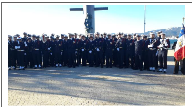
18 décembre 2021 Cérémonie Protée à La Seyne/mer et Toulon