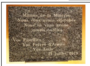
15 Novembre 2021 à Toulon Remise Plaque Minerve

Le temps a passé vite, il est déjà 13 Heures et l'apéritif nous attend, suivi d'un bon repas dans une ambiance sympathique où nous sommes tous heureux de nous retrouver.