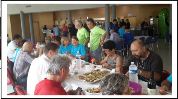
Congrès National au GRAU DU ROY