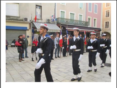
Evasion du Casabianca