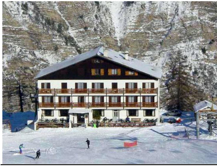
Hôtel La Pourvoirie