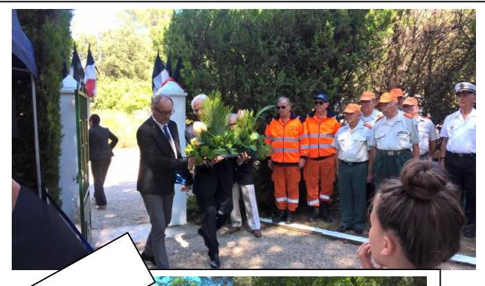
Le Fenouillet 13 juin 2018