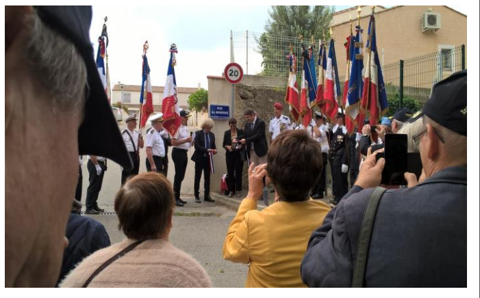
Remise des Brevets à la PMM CASABIANCA à CARPENTRAS le 2 juin 2018