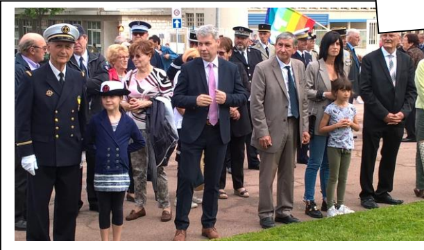
8 mai Fête de la Victoire à Martigues