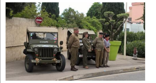
Salon des Jeunes à Martigues