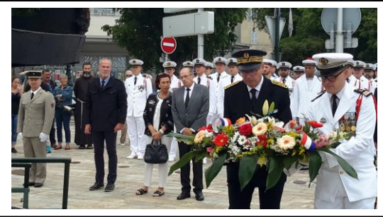
Réception à l'AMMAC BASTIA