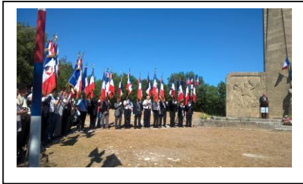
Ste Anne 12 juin 2017