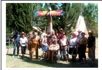
25 Juin Méchoui Les Indiens