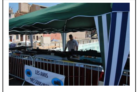
Remise des Brevets PMM Casabianca à Carpentras