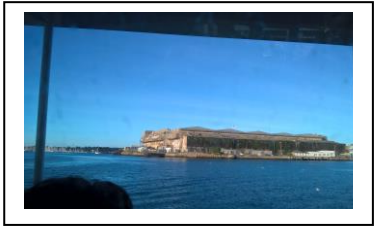
Seul jour de pluie La Ria d'ETEL